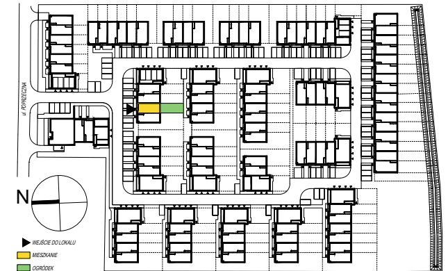
SCHEMAT PARTERU Z OGRÓDKAMI