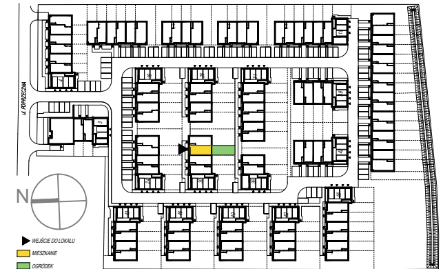
SCHEMAT PARTERU Z OGRÓDKAMI