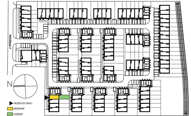
SCHEMAT PARTERU Z OGRÓDKAMI